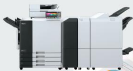
ORマルチフィニッシャー