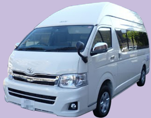
デモカー車両イメージ

※デモンストレーション可能な台数に限りがあるため、日程等のご希望に添えない場合があります。